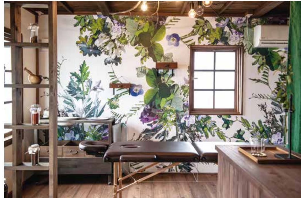
▲内装はすべて地元 福住地区の草柄で統一