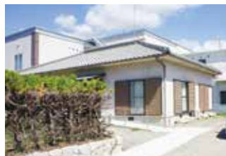
▲ 家族でのお試し居住にも対応できる余裕の広さ（赤穂市お試し暮らし住宅）

「田舎暮らしをしてみたい！でも生活していけるかどうか、実際に生活しながら試せればいいのに。」と、思っている方も多いはず。実は県内の市町では、比較的低廉な使用料で一定期間のお試し居住ができる住宅を整備しています。また、県でも県営住宅の空き室を使ったお試し住宅を県内各地に設置しています。 生活体験だけではなく、物件探しの拠点として利用するなど、利用目的もさまざま。利用者からも好評です。