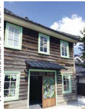
▶半壊していた旧郵便局を改修し、 1階はギフトギャラリー、2階は ボディタッピングのお店として活用